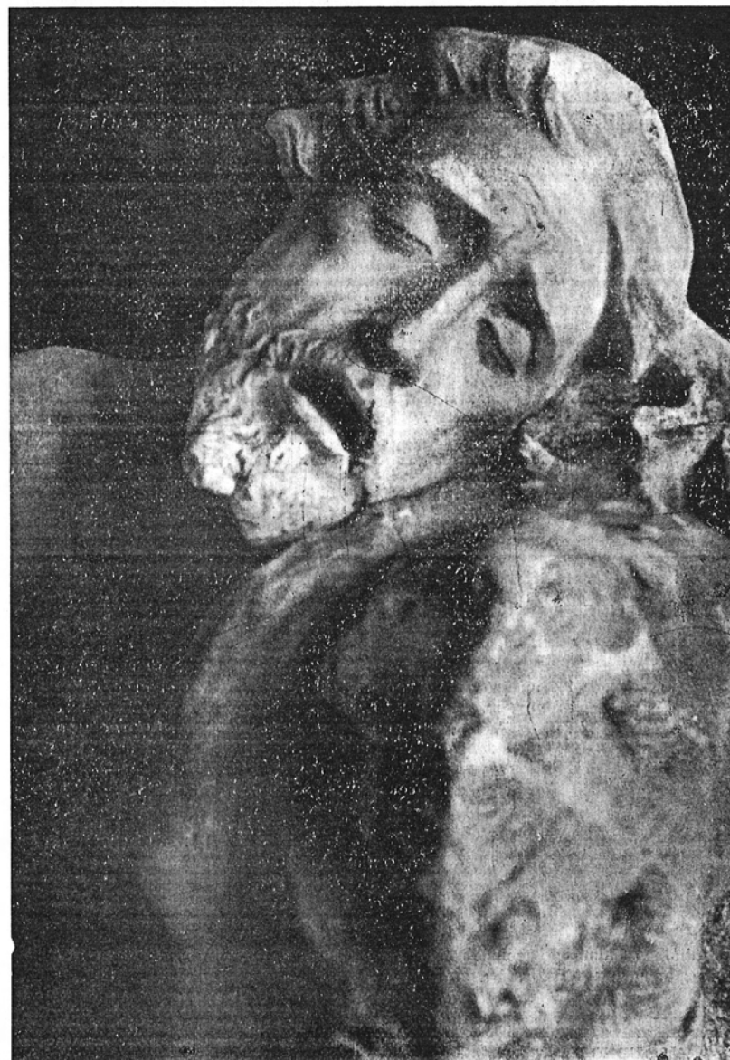
Semana Santa 1955